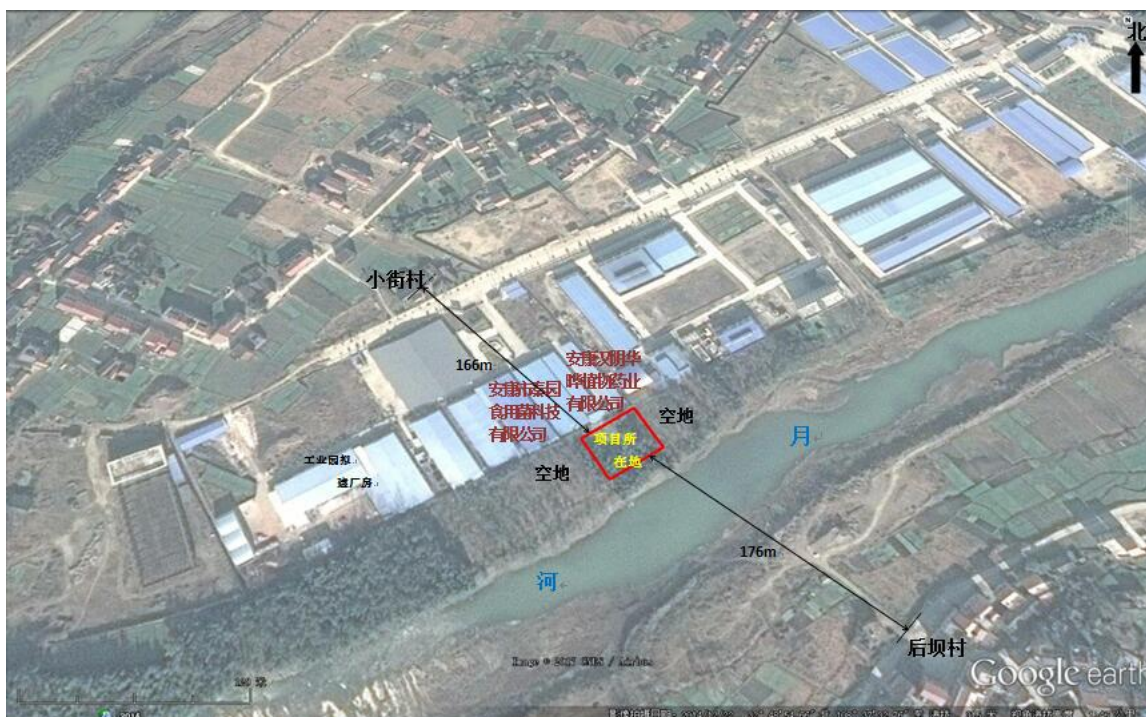
图 1 项目四邻关系示意图