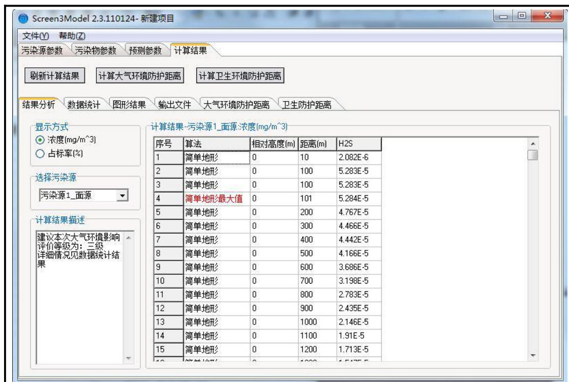
图 2 硫化氢大气环境影响预测图