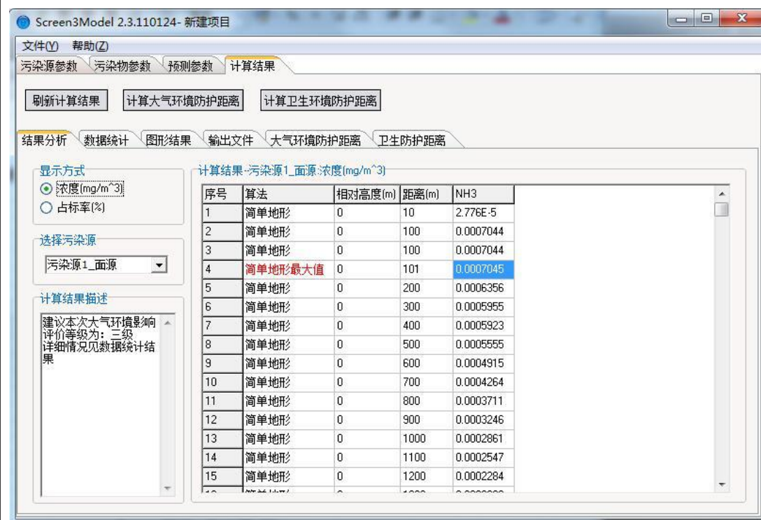
图 3 氨气大气环境影响预测图